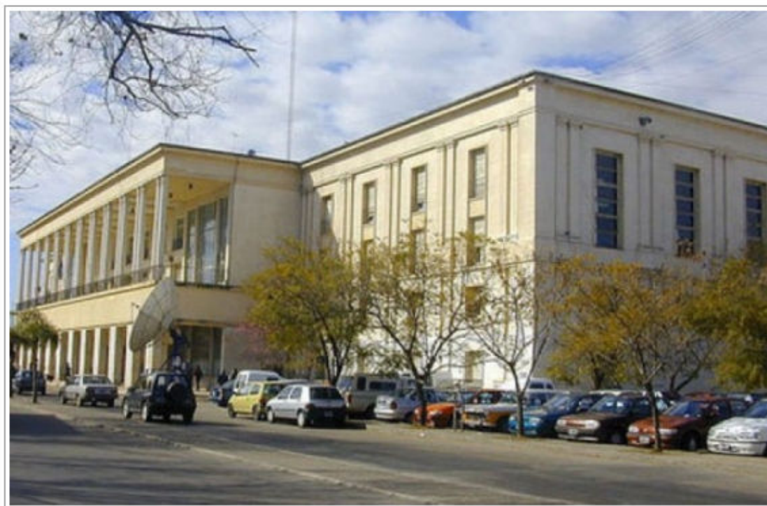
Pabellón Argetina, Universidad Nacional de Córdoba

El pasado 13 de marzo de 2013 terminó el proyecto "Fortalecimiento de la Dimensión Internacional de la Universidad Nacional de Córdoba, Argentina (UNC)", que ha sido financiado por la AECID desde el año 2009, y que ha relacionado a la Universidad Complutense de Madrid (UCM) con la UNC