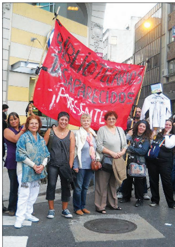
Marcha de homenaje, Buenos Aires, 24 de marzo de 2012