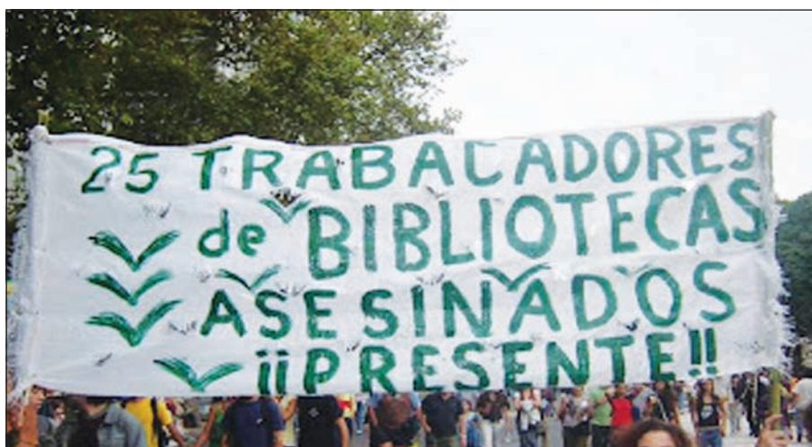
Primera convocatoria recordando a los bibliotecarios desaparecidos. Marcha a los 30 años del golpe militar, 24 de marzo del 2006

Creemos que reconstruir y recuperar la militancia de éstos compañeros, su compromiso social y profesional, nos ayuda a recuperar -a su vez- la profesión como una cuestión de compromiso social y político con la historia que nos toque en suerte, a darnos cuenta que no podemos ser espectadores asépticos. Y que aún podemos -los bibliotecarios- ser también activos protagonistas y promover en los futuros profesionales un cambio de actitud frente a nuestro tiempo histórico. Es destacable el hecho del debate que comenzó hace unos años en Argentina sobre la necesidad de los bibliotecarios a afiliarse a un sindicato o crear uno propio para defender sus intereses.